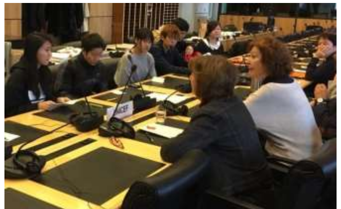
意見表明を前に権利委員の方々と歓談する子どもたち