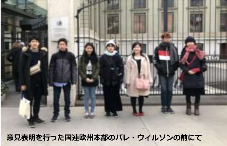
意見表明を行った国連欧州本部のパレ・ウィルソンの前にて