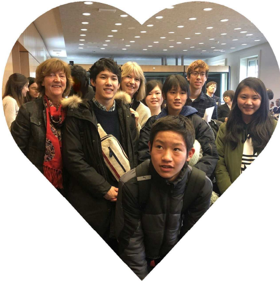
委員の方々と写真に収まる子どもたち